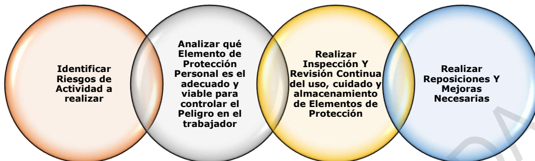
Fig. 2 Características de los Elementos de Protección

(Según Decreto 1072 de 2015; Resolución 2400 de 1979 y Resolución 0312 de 2019)